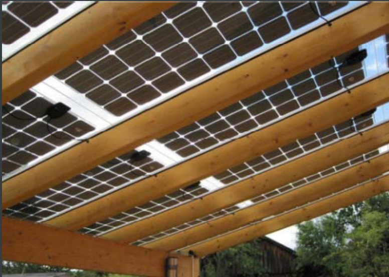
Carport , terrasse eller indgangsparti