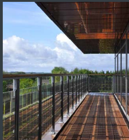
Værn balkon Energimidt