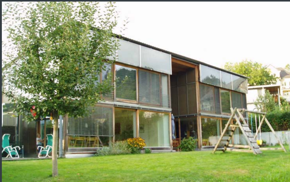
Dobbelthus Batchuns Østig